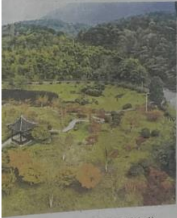
叶红的如火焰,橘的似玛瑙,漫步枫林